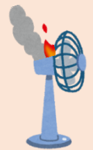
古い家電の 注意点