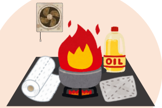
こんろ使用時の注意点