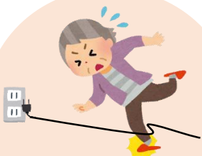
住宅内での 転倒・転落防止