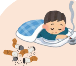
寝たばこ・吸殻の始末