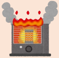
ストーブ使用時の注意点