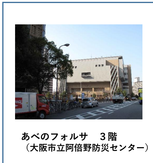
あべのフォルサ 3階 （大阪市立阿倍野防災センター）