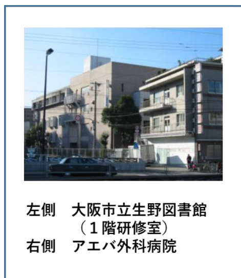
左側 大阪市立生野図書館 （1階研修室） 右側 アエバ外科病院