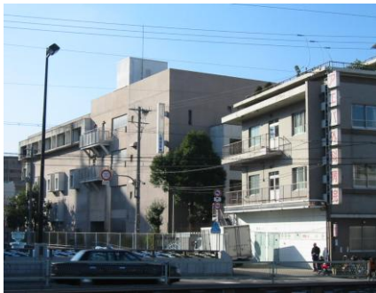
左側 大阪市立生野図書館 (1階研修室) 右側 アエバ外科病院