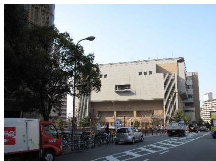
あべのフォルサ 3階 (大阪市立阿倍野防災センター)