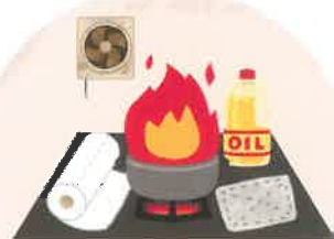
こんろ使用時の注意点