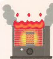
ストーブ使用時の注意点