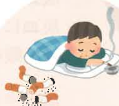
寝たばこ・吸い殻の始末