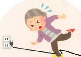
住宅内での 転倒・転落防止