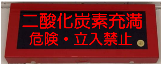
ガス消火剤放出表示灯