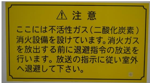
注意銘板(防護区画内)