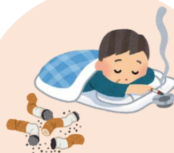
寝たばこ・吸殻の始末