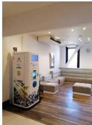
大阪城公園内3か所 (写真はMIRAIZA OSAKA-JO)

また、持ち運びが可能な移動型給水スポット（ウォーターディスペンサー）を新たに製作し、市民・お客さまが多数参加されるイベントなどで活用します。