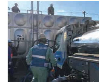
応急給水実働訓練