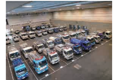
日本水道協会主催の全国訓練