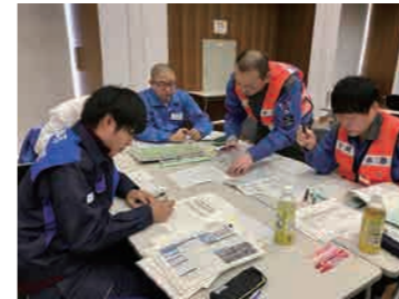
想定に基づいた図上訓練

他都市との相互応援連携に基づいたさまざまな訓練を実施し、実災害においても柔軟に対応できるように努めています。