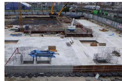
柴島浄水場上系配水池の耐震化工事