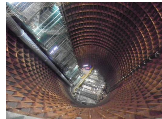
浪速枝管の新設工事（発進立坑）