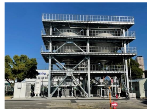
粉末活性炭注入設備 (庭窪浄水場)