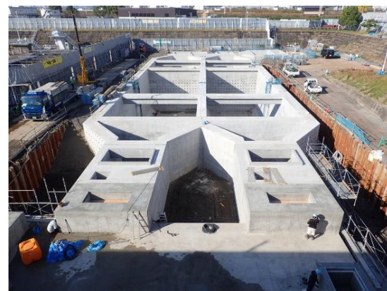
取水施設の耐震化工事（楠葉）