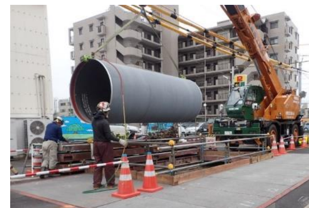
管路の耐震化工事（異第1送水管）