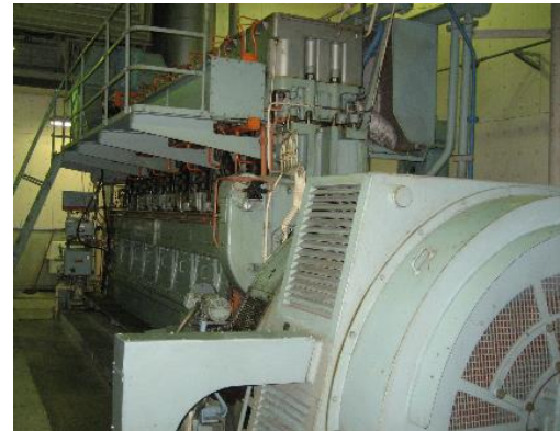
施設運転用自家発電設備 (異配水場)