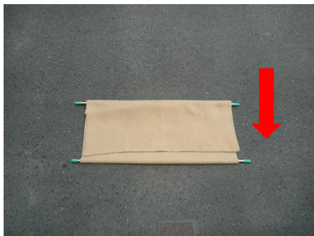
⑥ 最後に残りの毛布を折り返して2本の物干し竿を包んで完成です。