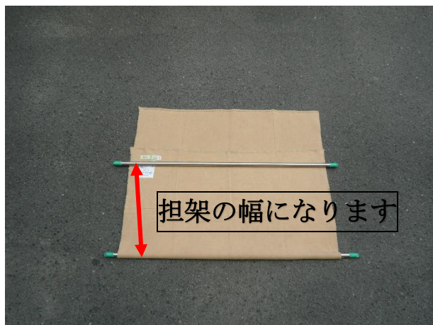
④ もう1本の物干し竿を、折り返した毛布の端より内側に来るようおきます。