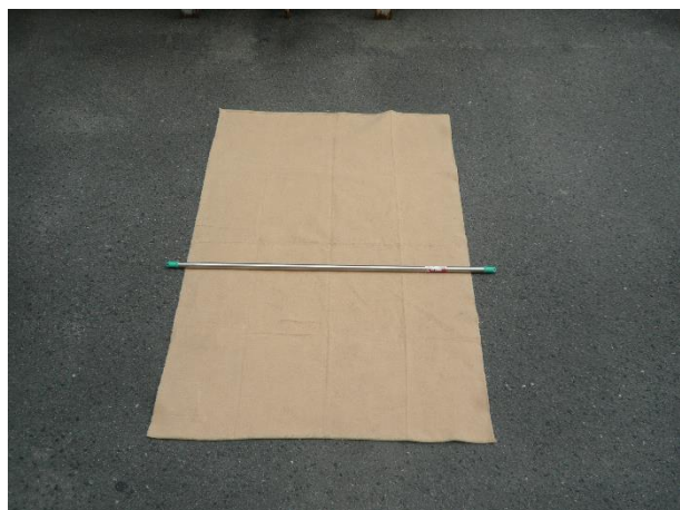
① 毛布の1/3のところに物干し竿をおきます。