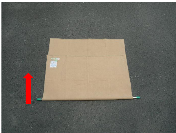
③ 次に、物干し竿を包むように毛布を折ります。