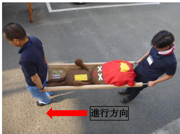
⑦ 担架で人を運ぶ時は負傷者の足を進行方向に向け、下ろす時は足から下ろしましょう。