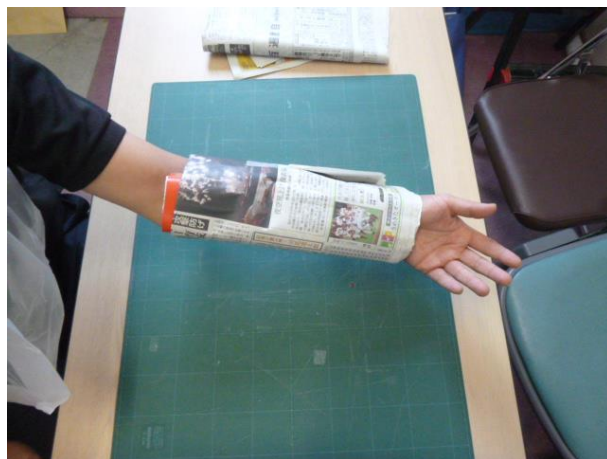
⑥包帯代わりのネクタイ・ストッキング・テープなどで固定します。