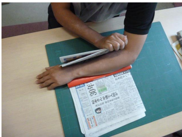
⑤新聞紙などで腕を包むようにします。