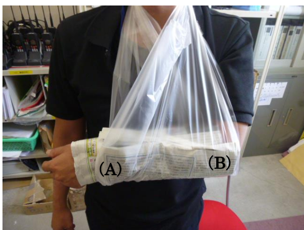
⑦底まで切った側 (A) が指側に、10 cm残した側 (B) が肘側に来るように腕を通します。持ち手の部分を重ねて頭を通して首に架けて完成です。