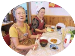
さざんか平林協議会 食事サービスの様子

各地活協(地域活動協議会)では、高齢者の方のふれあいと健康増進のためバランスのとれたお弁当や手づくりの料理を提供する「食事サービス」を実施しています。また、来場が困難な方には、配食サービスを行っている地域もあります。ご興味ある方は下記問合せ先までお電話ください。