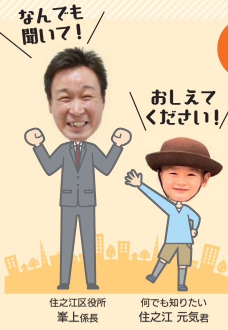
住之江区役所 峯上係長 何でも知りたい 住之江 元気君

Q 区政会議って何？ 区民のみなさんのご意見を色々な取組に反映するために、区民の代表の方に参加していただく会議だよ。