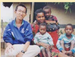
ジンバブエで青年海外協力隊員として活動中の若き日の区長です

グローバル社会を生きぬく子どもたちを育成するため、多様な文化の体験や、海外とのコミュニケーション、国際協力の経験者による講話などを計画しています。子どもたちが楽しく学びながら「生きる力」や「考える力」を育みます。