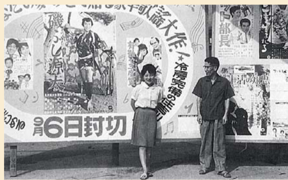
住吉劇場 昭和30年代中頃

ちょうどその頃、地域には商店街や映画館なども続々と建設され、姫松橋通りは‘加賀屋銀座’と呼ばれる賑やかさだったとか。庄左衛門町(今の西加賀屋西交差点のあたり)には市電住吉川駅があって、地域のひとの足として活躍しました。