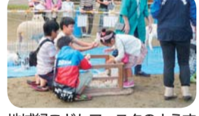
地域緑子どもフェスタのようす