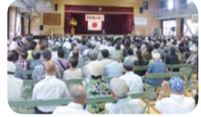
住吉川・高齢者の集いのようす