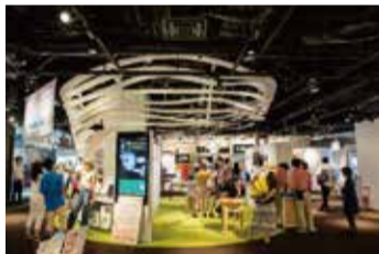
▲多彩な技術やアイデアが集う「ナレッジサロン」や、来場者参加型の展示空間「The Lab.(ザ・ラボ)」では、これまで次世代電気自動車などが商品化されてきました。

問い合わせ 都市計画局うめきた整備担当 ☎6208-7838 ☎6231-3751