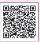
▶子育てマップ (マップナビをおさか)