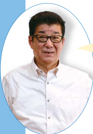
大阪市長 松井一郎

これまで、同じ方向を向いた知事と市長が連携を強め、大阪の成長への流れが生まれています。「副首都・大阪」の地位を確立し、成長の流れを確かなものとするためには、それを制度面から支える新たな大都市制度が必要です。