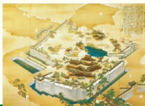
聚楽第図(大阪城天守閣蔵)