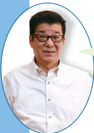
大阪市長 松井一郎

大阪市では、1人の市長が、広域行政も担いながら住民に身近な行政サービスの提供に取り組んでいます。今後、さらに複雑化・多様化が進む市民ニーズに対応していくには、今の270万人のままでは規模が大きすぎます。