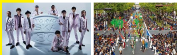
出演者:東京スカパラダイスオーケストラ