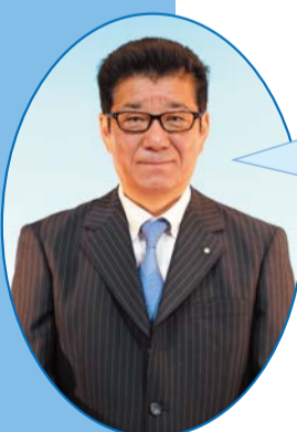
大阪市長 松井一郎

現在の大阪市は、住民に身近な行政と広域的な行政、その両方を担っています。特別区制度のポイントの一つは、特別区と大阪府の 役割分担を徹底 することです。