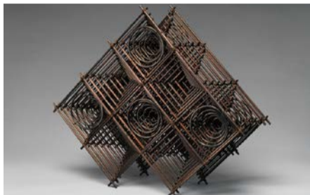
《未来への歓喜》三代田辺竹雲斎 The Abbey Collection, "Promised Gift of Diane and Arthur Abbey to The MET."

メトロポリタン美術館所蔵のアビー・コレクションから近現代の竹工芸品75件を展示します。現代作家・四代田辺竹雲斎さんによる、美術館の吹き抜けの空間を生かした巨大な竹のインスタレーションも制作されます。