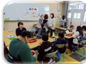
ウィンターフェスタ