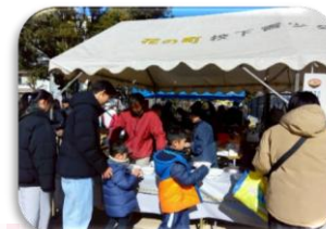
ウィンターフェスタ