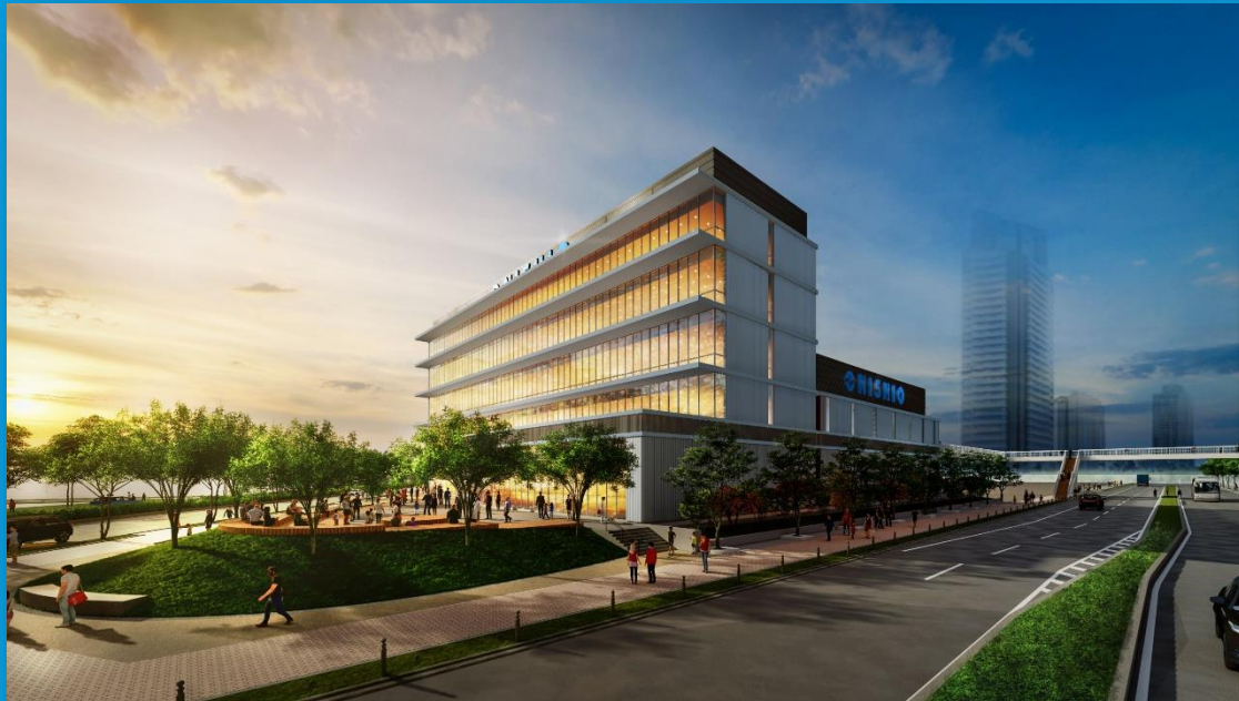
イメージは2021年3月時点のものです

住之江区南港北のコスモスクエア地区に建設予定である「西尾レントオールR&D国際交流センター（仮称）」を拠点に、咲洲の地域活性化から区全体に広がるまちづくりを協働して進めます。