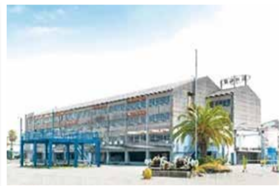
クリエイティブセンター大阪(名村造船所大阪工場跡地)

北加賀屋にはここで紹介している以外にもたくさんのアートスポットがあるよ!お気に入りのアートを見つけてね!