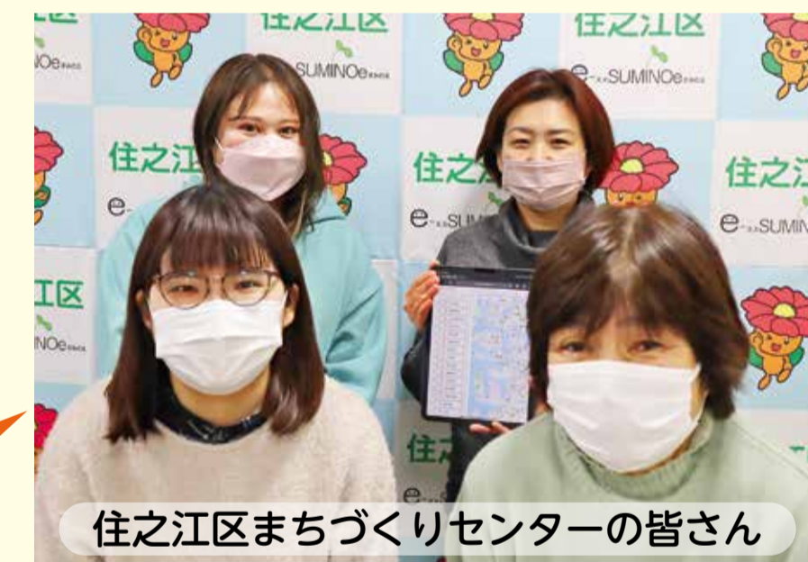
住之江区まちづくりセンターの皆さん

など、区民の皆さまに便利に使っていただけるポータルサイトになります。私たちもお手伝いします！