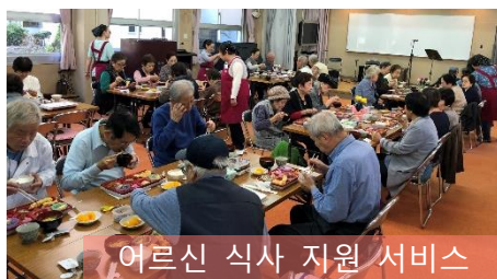
어르신 식사 지원 서비스