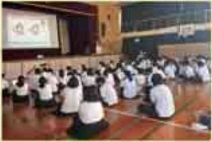
▲認知症サポーター養成講座の様子

太陽の町地域では認知症サポーター養成講座を実施し、認知症の人を支えるまちづくりを行っています。