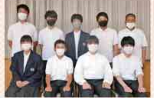
▲南港北中学校3年生の皆さん

認知症サポーター養成講座を受講したことによって、困っている人に声掛けをしようと思うようになりました。実際に体調不良で歩くことができなくなっていた高齢者を見かけた時に、率先して声を掛け、助けることができました。これからは私達中学生が困っている人を見かけた時に積極的に声掛けできる環境を作りたいです。