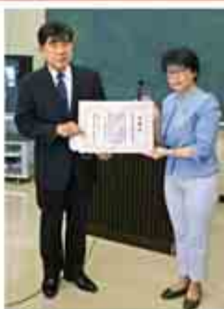
芳野医師会会長と末村区長 ※役職は贈呈時点

住之江区医師会様からは「これからも区民の皆様の健康と命を守るため、地域医療に貢献してまいります。」と、有難いお言葉をいただきました。