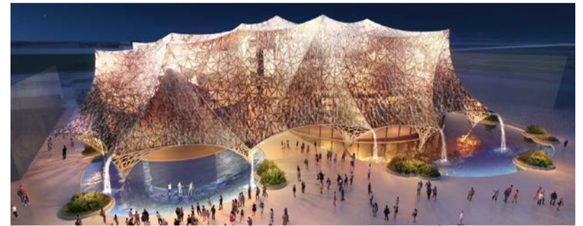
大阪ヘルスケアパビリオン Nest for Reborn