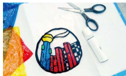
マンホールふたのデザインイメージ

4月にリニューアルオープンした下水道科学館で、マンホールふたのデザインや水のおもしろ実験など、子どもや親子で楽しめるイベントを多数開催。日時はプ