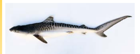
大阪湾で捕獲されたイタチザメ

2019年以降に収集された標本を中心に展示し、その標本の意義と博物館での資料収集活動について紹介します。