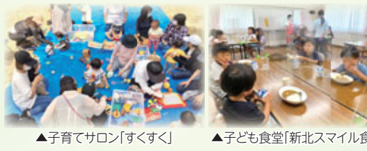
▲子育てサロン「すくすく」 ▲子ども食堂「新北スマイル食堂」

子ども食堂の取組み自体は令和3年度から始めましたが、昨年度は新型コロナウイルス感染症の影響により一度も開催することができませんでした。しかし、そのような中でも登録いただいているご家庭と関係を築くため、お子さんにも保護者の方にも喜んでいただけるようなお土産(食材等)の配付を兼ねた訪問を続けてきました。今年度は状況を見ながらの開催にはなりますが、「新北スマイル食堂」は“子どもたちに地域を好きになってもらう”ということを目的としており、子どもたちはもちろん、関わっている大人たちにとっても、ホッとできる・楽しめる場所にしていきたいです。