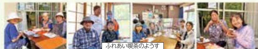
ふれあい喫茶の様子

南港緑地域では様々な取組みを実施しています。地域活動にご興味のある方は、福祉会館までお問合せください！