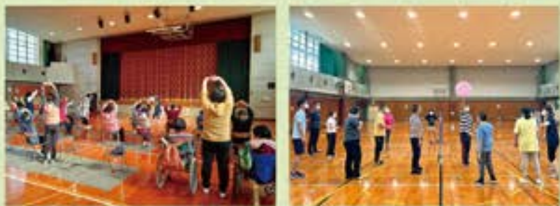
「住之江区障がい者スポーツ・レクリエーションひろば」での風景

住之江区役所は、大阪市における「障がい者スポーツ振興の取組」について、①地域団体等の障がい者スポーツ振興の取組の推進、②地域人材の育成及び活用、③理解促進のための周知及び啓発の3つの柱を踏まえた更なる障がい者スポーツの振興に向け取り組みを進めます。