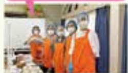
▲ボランティアの皆さん