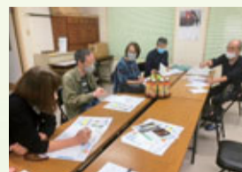
▲広報紙「花だより」編集会議の様子

年4回季節ごとに発行しており、バラエティーに富んだ内容にすることを心がけています。例えば、夏祭り、各地域活動のお知らせ、社会情勢に沿ったお役立ち情報等、住民の皆さんにとって必要な情報を掲載しています。