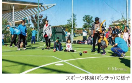
スポーツ体験(ポッチャ)の様子

いたトークイベントなどを開催。 日 11/6(日)11:00～15:00 場 てんしば ☎ 経済戦略局スポーツ課 ☎ 6469-3882 FAX6469-3898