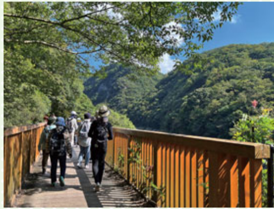
▲ウォーキングの様子