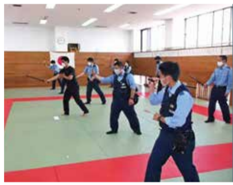
◀逮捕術訓練の様子