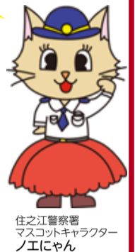
住之江警察署 マスコットキャラクター ノエにゃん