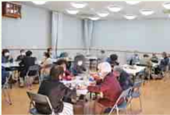
▲ふれあい喫茶の様子