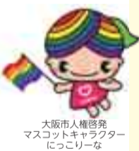
大阪市人権啓発 マスコットキャラクター 「にっこりーな」

だれもがありのまま受け入れられ、自分らしく生きることができる社会をめざし、正しい知識と理解を深めましょう。