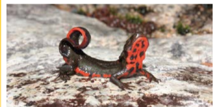
アカハライモリ

動物や植物、菌類、鉱物、人工毒など自然界に存在する毒について、動物学、植物学、地学、人類学、理工学の各研究分野のスペシャリストが解説します。 日 3/18(土)～5/28(日) 9:30～17:00(入館は16:30まで)、月曜休館(3/27・4/3・5/1は開館) 場 自然史博物館 料 大人1,800円ほか 問 大阪市総合コールセンター ☎4301-7285 FAX6373-3302