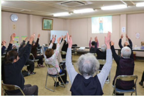
▲「いきいき百歳体操」の様子▼