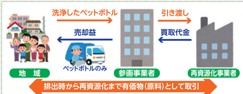
▲ペットボトル回収の仕組み

この活動は、地域のみなさんの協力があって初めて成り立つ活動です。これからもごみの分別を徹底し、地域が一体となって、活動をより発展させられるように継続していきたいです。