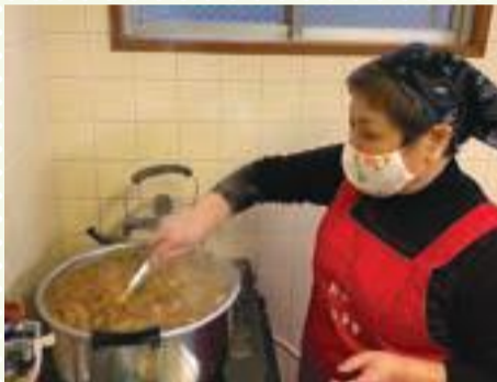
▲子どもたちに一番人気のカレーライス