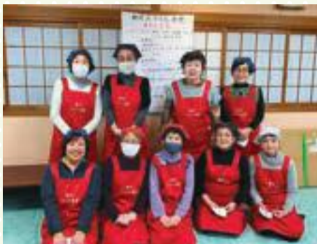
▲ボランティアのみなさん