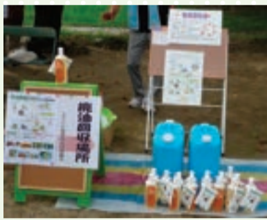
▲廃油回収の様子(地域大掃除)