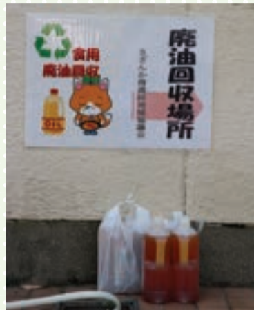
▲廃油回収の様子(ふれあい喫茶)