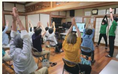
▲健康体操をしている様子

「もりもり健康長寿サロン」は、地域の高齢化が進み一人暮らしの高齢者の方が増えている中で、高齢者の方々が外に出るきっかけとなり、参加した方々と、ふれあえる機会を作れたらという想いから実現しました。健康体操に加え、瞬発力・記憶力を問うゲームやクロスワードパズルなどの脳トレーニングは、みんなで楽しく体を動かし、脳を活性化させることを重視しています。参加者の中には学生と会話をすることを楽しみに参加されている方もいらっしゃり、学生にとっても将来のための学びになっていることから、双方にとって貴重な時間となっています。太陽の町地域では太陽福祉会館を拠点として、サロンをはじめとし、ふれあい喫茶、百歳体操、脳トレサロンなど多くの活動を実施しています。今後も地域のたくさんの方々に参加していただき、交流する機会を作っていきたいです。