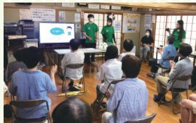
▲脳トレーニングの様子 (特定の数字で手を叩く)