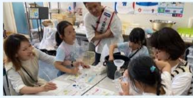
水に関する実験の様子

水に関するワークショップや体験型のイベント、謎解きなどを開催。対象は未就学児～小学生。定員各回70人。 日 ①7/20(土)・21(日)②7/27(土)・28(日)各日10:00～11:15、12:20～13:35、14:30～15:45 申 ①7/7 ②7/14 各17:00までにHPで。 場 水道記念館 ☎06-6320-2874 FAX 06-6324-3114