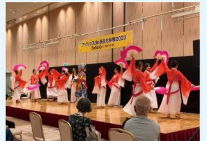
昨年の様子(中国の京劇)

日本在住の外国人による言葉、文化、料理の紹介や、伝統楽器の演奏、踊り、劇などを楽しめるイベントを開催。さまざまな文化への理解を深めましょう。 日 8/3(土)11:00～16:30 場 大阪国際交流センター(天王寺区) 問 (公財)大阪国際交流センター ☎06-6773-8989 FAX 06-6773-8421