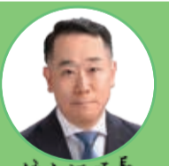
住之江区長 藤井秀明