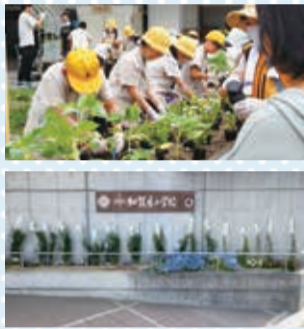
▶小学生が植え替えている様子