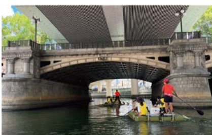
手漕ぎボート体験の様子

浄水場や下水処理場の施設見学、手漕ぎボートによる東横堀川の周遊体験を通して「水」について学びます。対象は市内在住または在学の小学生とその保護者(1組4人まで)。定員80人。昼食・飲み物は持参してください。