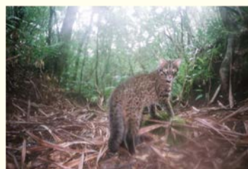
イリオモテヤマネコ