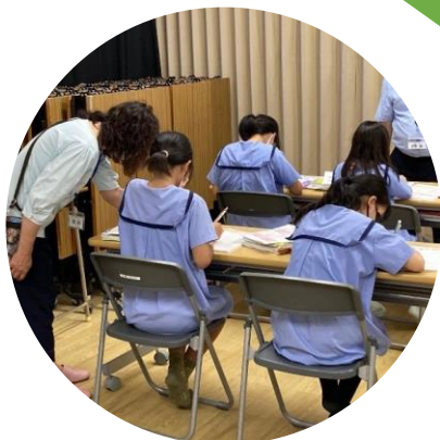
基礎学力アップ事業

子どもたちの未来がより充実したものとなるよう、一人ひとりが「こうなりたい」「そのためにこれを学びたい」と、将来を思い描きながらチャレンジする気持ちを持ち、困難に立ち向かいやり抜く力が身につくよう取り組みます。