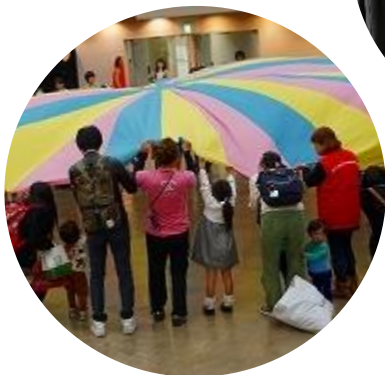
子育て応援イベント