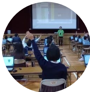
すみのえ未来塾事業