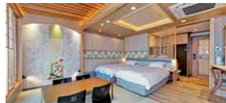
客室(スイート和洋室コネクト)

フェリー「さんふらわあ」は、快適な船旅と非日常の体験を提供する日本屈指の大型フェリーです。展望デッキからは美しい海の景色を一望でき、船内では充実した設備でリラックスしたひとときを過ごせます。ペットと一緒に過ごせるウィズペットルームも備えておりご家族全員でゆっくりお過ごしになれます。