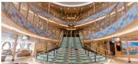
船内のアトリウム