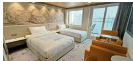
客室(ロイヤルスイート)

パンスターミラクル号は大阪・住之江区と韓国・釜山を結ぶ国際フェリーです。夕食・朝食ビュッフェが付いており、航行中は瀬戸内の島々や橋をくぐるダイナミックな景色をお楽しみいただけます。