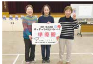
準優勝チーム「コスモス」の皆さん