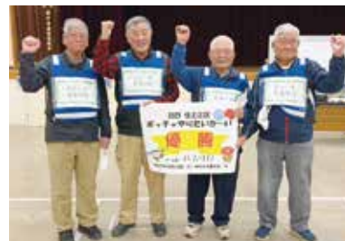
優勝チーム「住吉川ID」の皆さん

12月13日(土)に、すみのえ舞昆ホールにて、誰でも楽しむことができる障がい者スポーツを通じて交流を深めることを目的としたボッチャ大会を開催しました。多数の方々にご参加いただき、白熱した試合が繰り広げられる中、みんなで楽しく盛り上がりしました。